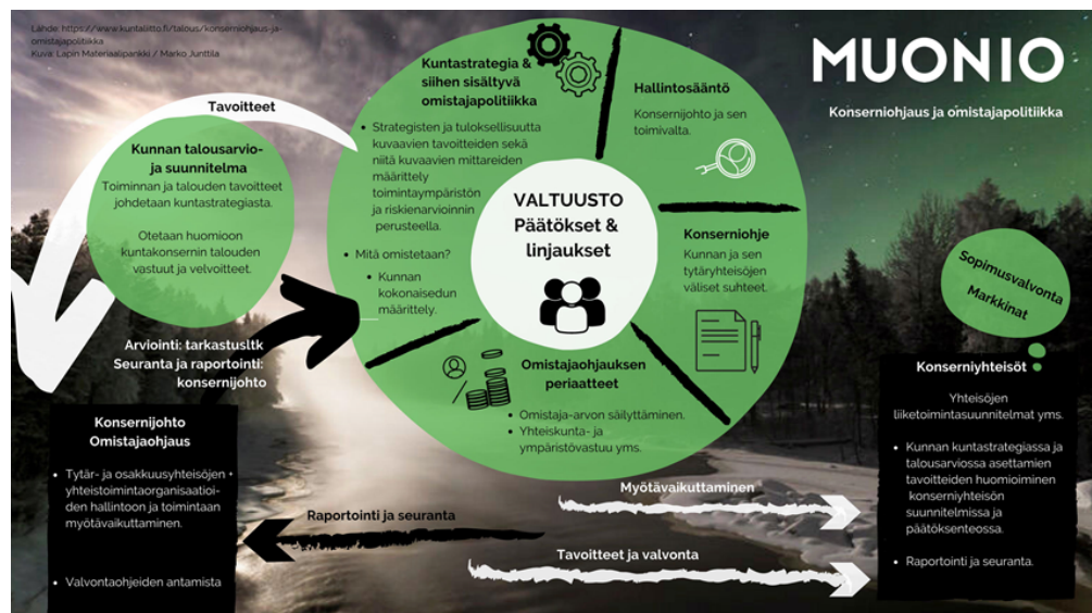
Kuva 1: Omistajaohjaus kuntakonsernissa (mukailien Kuntaliitto 2018).

Omistajan tahdon ilmaisee kunnanhallitus. Kuntalain 39 §:n mukaan kunnanhallitus vastaa kunnan toiminnan omistajaohjauksesta ja toimintojen yhteensovittamisesta. Omistajaohjauksen keinoja ovat muun muassa perustamissopimuksiin, yhtiöjärjestysmääräyksiin, muihin sopimuksiin, henkilövalintoihin, ohjeiden antamiseen kuntaa eri yhteisöissä sekä niiden toimielinten kokouksissa edustaville henkilöille sekä muuhun kunnan määräysvallan käyttöön liittyvät toimenpiteet.